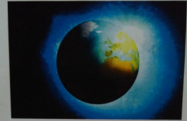
Foto-Ausstellung: „Ich bin da“ Lost in space – oder: Der liebe Gott bei uns am Frühstückstisch?

AKTUELL noch bis zum 5.10. - täglich von 8-20 Uhr geöffnet!